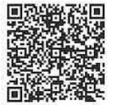
Allgemeiner-Teil_ASOneu (Anlage 1 und 2)